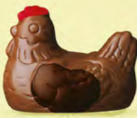
Duo praliné et ganache caramel