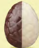
Praliné avec éclats de noisettes