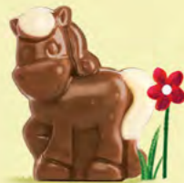
Moelleux au chocolat