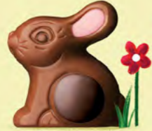
Praliné et riz soufflé