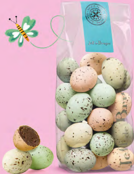
Praliné tendre ou praliné et éclats de crêpe dentelle