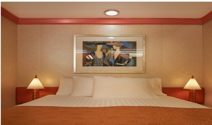
Vue Mer avec Balcon