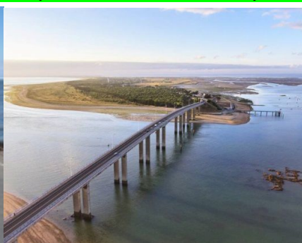
île de Ré