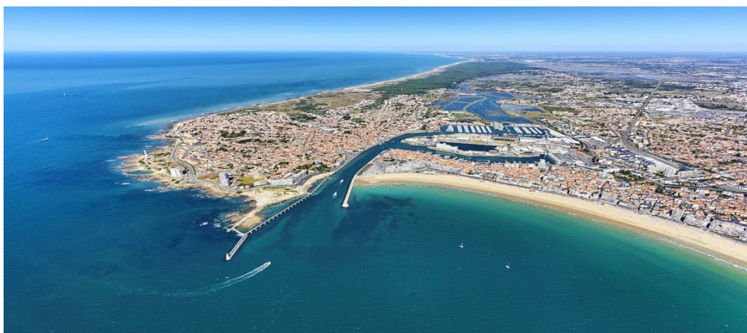
Les Sables d'Olonne

Gaston GAY 1950, route d'Orcières « Les Thomés » 05260 CHABOTTES