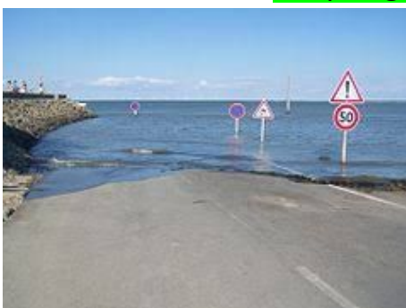
Île d'Oléron (passage du GOIS)

Cinq magnifiques excursions comprises dans le forfait !